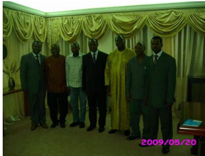
Photo de famille avec le Ministre des Affaires Etrangères et de l'Intégration Africaine (au milieu en costume noir)