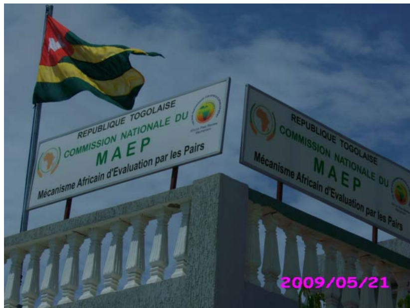
Le siège du MAEP à Lomé