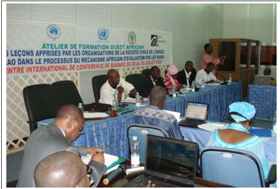
Une vue de la plénière

Nous restons convaincus, au regard des résultats probants enregistrés, que les représentants de la SC des pays de la CEDEAO sont mieux outillés et s'engagent à participer activement dans le processus du MAEP aux côtés des Gouvernements au sein des Commissions Nationales de Gouvernance.