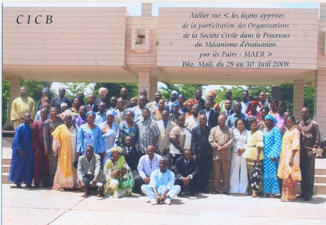
Photo de famille des participants

« Les Leçons apprises de la participation des Organisations de la Société Civile ouest africaine dans le Mécanisme Africain d'Evaluation par les Pairs »