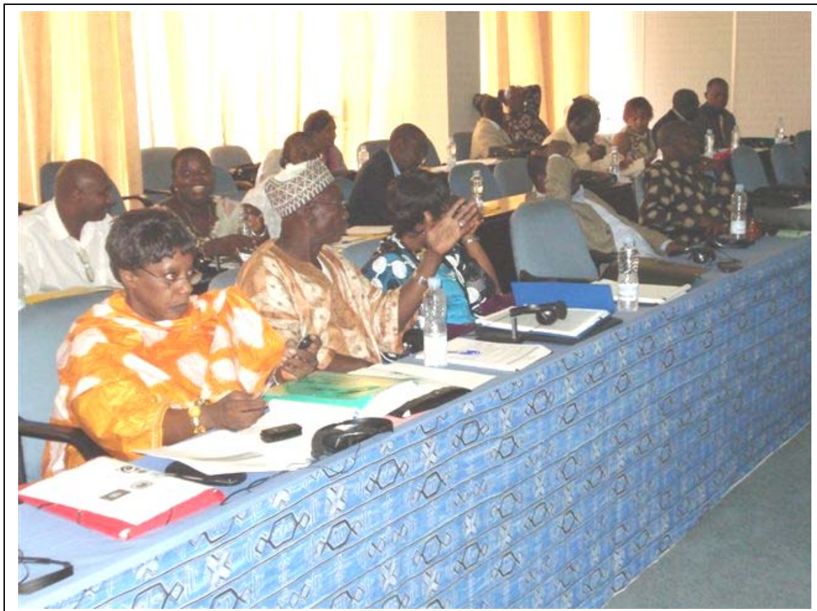
Vue des participants

En conclusion , l'atelier a recommandé la finalisation de la déclaration, sa traduction rapide en anglais et sa distribution auprès des participants. Une autre priorité est de finaliser le rapport de l'atelier qui devrait être mis à la disposition des participants dans les meilleurs délais.